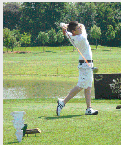
A sinistra i premiati a Fioranello, a destra il tee off al Golf Le Pavoniere

M ese intenso quello di maggio per l'ormai collaudato Richard Ginori 1735 Masters "Challenge the White", circuito di golf tra i più affascinanti nel panorama italiano.